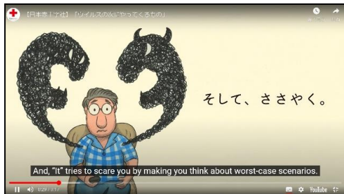
「ウイルスの次にやってくるもの」

日本赤十字社は、全国の赤十字病院を中心に新型コロナウイルス感染症の治療および感染拡大防止のための活動に取り組んでおります。