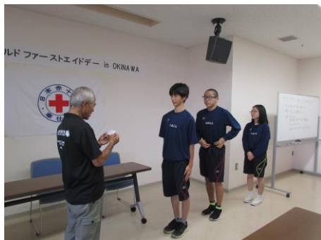
JRC メンバー参加しました。

赤十字では、毎年9月の第2土曜日を「ワールド・ファーストエイド・デー」と位置づけ、日本国内をはじめ、世界中の赤十字で救急法普及イベントを開催しています。沖縄県支部では、不慮の事故や急病に対する救命処置の知識と技術を学ぶため、「ワールド・ファーストエイド・デー」を9月14日（土）に開催し多くの人にAEDや救急法の実技を体験して頂きました。