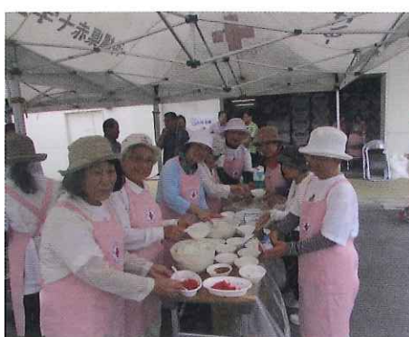
赤十字ボランティア