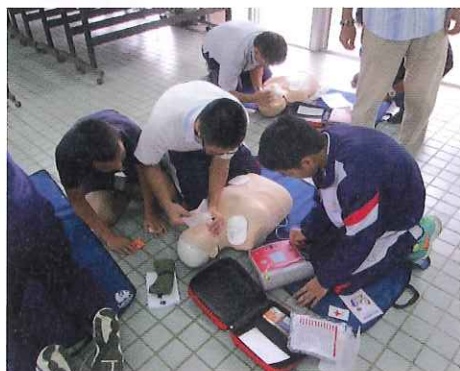
救急法などの講習