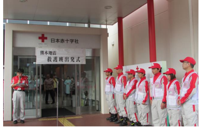
熊本に向けて出発する日赤沖縄救護班