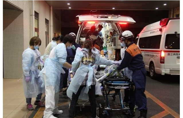
深夜でも患者が次々を運ばれた熊本赤十字病院