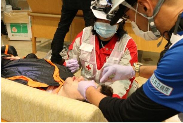
熊本赤十字病院での医療活動