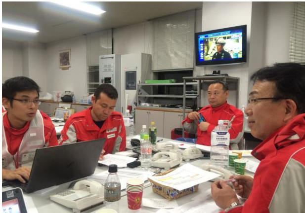
災害対策本部を支援する沖縄県支部職員