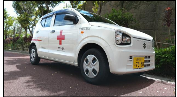
沖縄市地区の車両

本来であれば4月の下旬に各地区分区長をお招きしての贈呈式を執り行う予定でしたが、新型コロナウイルス感染症による緊急事態宣言の発出を受けて式典は中止となりました。