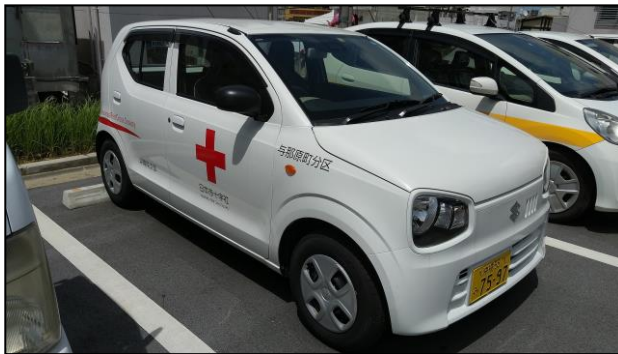
与那原町分区の車両

災害救護連絡車は、災害発生時に各地区分区から被災者への物資の輸送等様々な業務に使われることが想定されます。